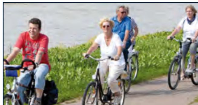
Felgenfest im Wesertal