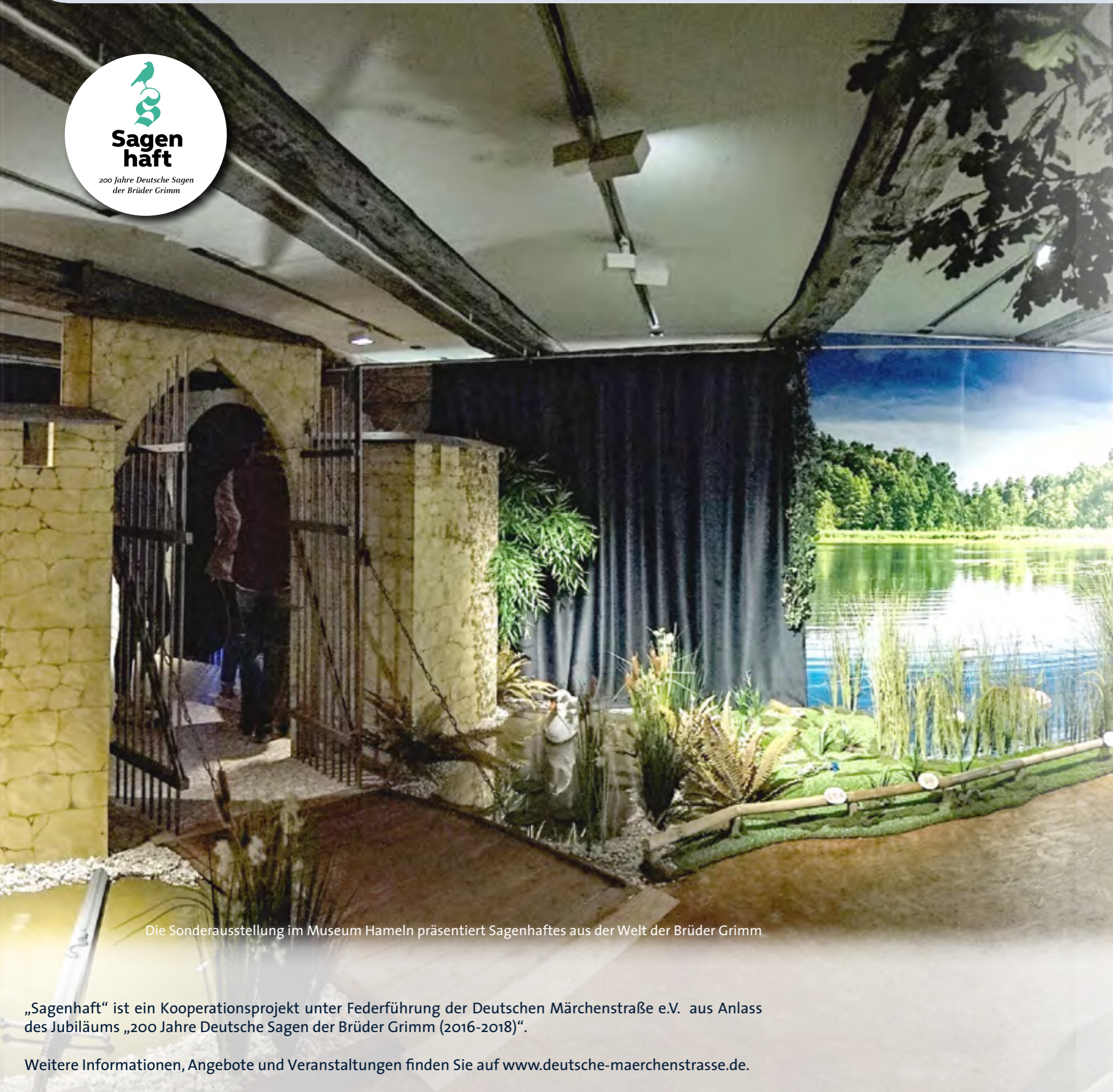
Die Sonderausstellung im Museum Hameln präsentiert Sagenhaftes aus der Welt der Brüder Grimm

„Sagenhaft“ ist ein Kooperationsprojekt unter Federführung der Deutschen Märchenstraße e.V. aus Anlass des Jubiläums „200 Jahre Deutsche Sagen der Brüder Grimm (2016-2018)“.