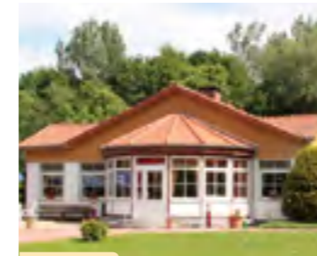
Plan B Nr.10