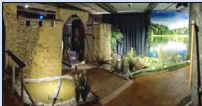
„Die Sagenwelt der Brüder Grimm“