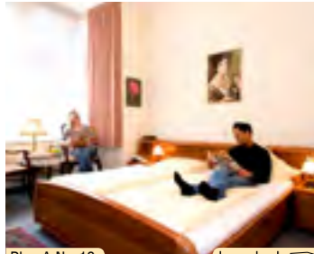
Plan A Nr. 13 hameln.de