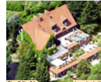
Plan B Nr. 24 hameln.de