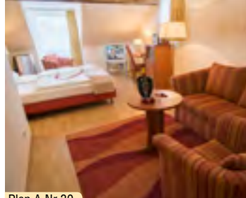
Plan A Nr.30