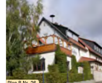
Plan B Nr. 26