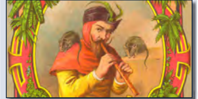
Ausstellung „Die Kunst des Rattenfängers“