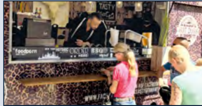
„VollMund“ Street Food Market