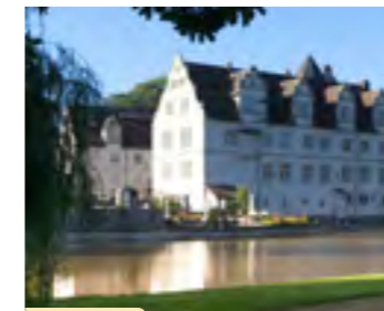
Plan B Nr.17