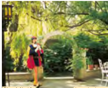
Plan A Nr.12 hameln.de