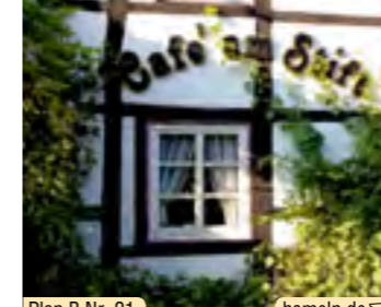
Plan B Nr. 21 hameln.de